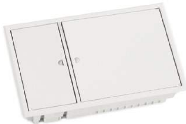
09QI2X15-D Quadro interior para 30 módulos + Diferencial