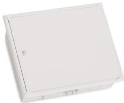
09QI2X10-D Quadro interior para 20 módulos + Diferencial